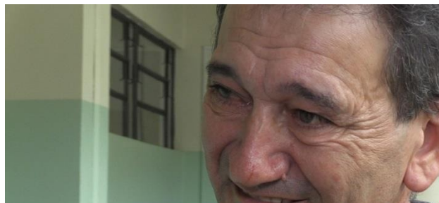
Professor decidiu que queria ensinar outros alunos do EJA, em Toledo